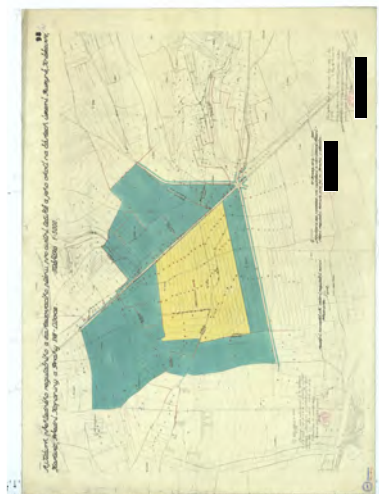
Rozměr (mm): 780x1070