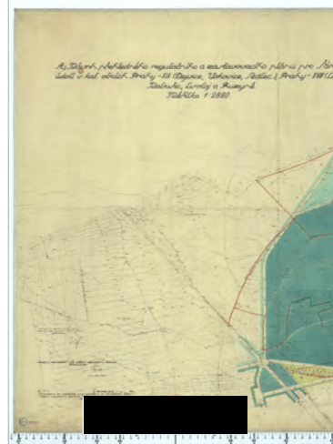
Rozměr (mm): 1130x1420