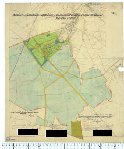
Rozměr (mm): 810x695