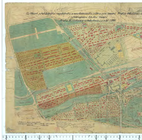
Rozměr (mm): 830x1470