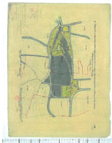
Rozměr (mm): 760x990