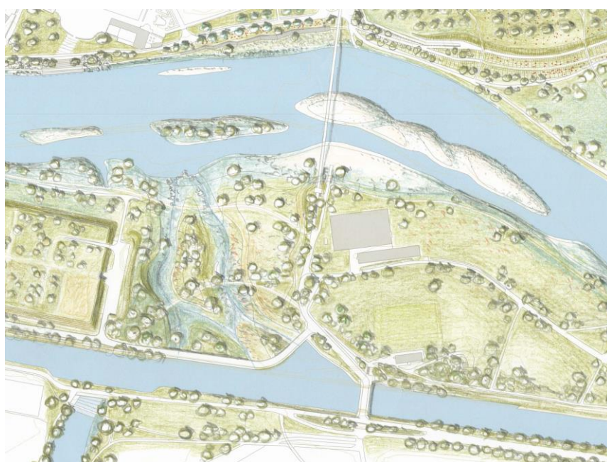
Detail koncepční studie tzv. „průlehu“ s možnými koryty potoka.