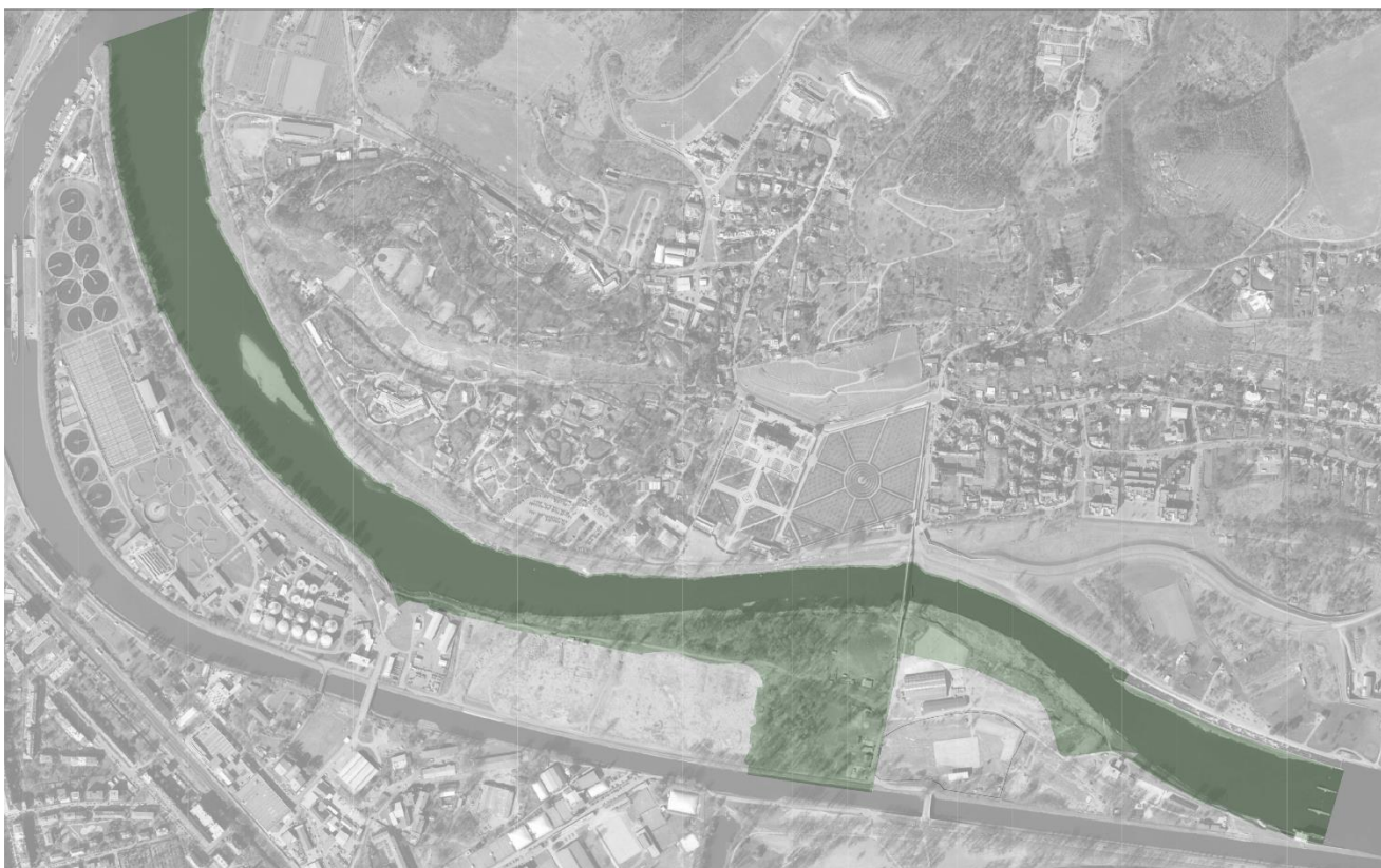
Vymezení území řešeného v projektu Divoká Vltava. Zdroj IPR Praha.