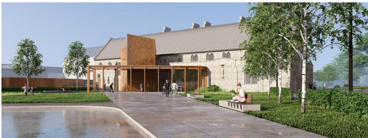
Konvent v hrabství Monaghan

Projekty musí být v souladu se zásadami Nového evropského Bauhausu – podpora řešení, která jsou udržitelná, inkluzivní a krásná.