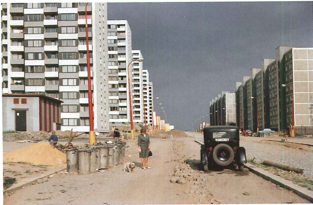
Prokop Paul: Sídliště Červený Vrch, asi 1963, Ateliér Paul; zdroj: Útvar rozvoje hlavního města Prahy.